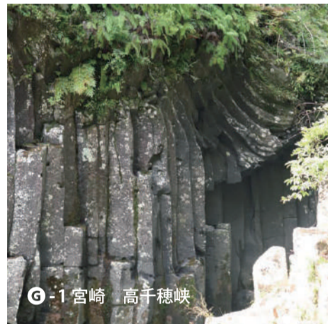
G-1 宮崎 高千穂峽