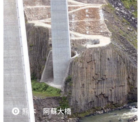
O 熊本 阿蘇大橋