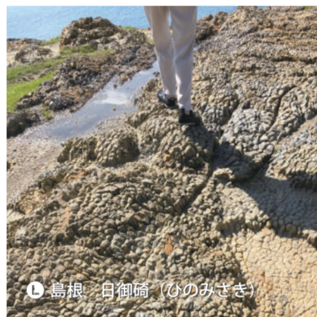
L 島根 白御崎 (びのみさき)