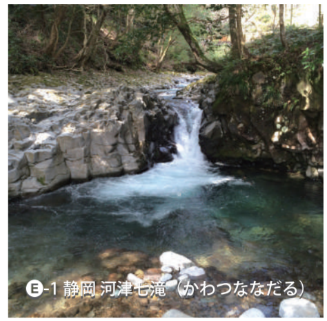
E-1 静岡 河津七滝 (めつななだる)