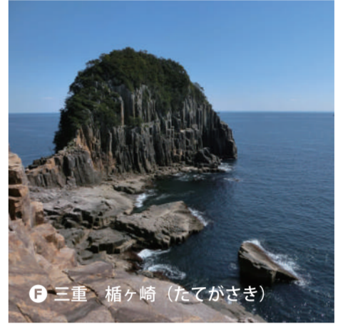
F 三重 桶ヶ崎 (たてがさき)