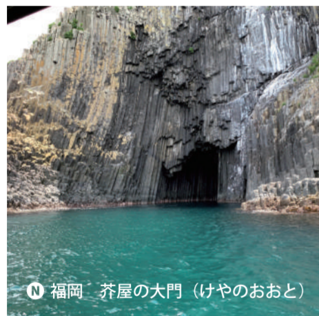
N 福岡 芥屋の大門 (けやのおと)

鬼界カルデラジオパークの関係者である私は、三島村という枠組みで活動方針を考える癖がある。それは間違っていないかもしれないが、役割をもらっているためか、つい任された行政区内ばかりに焦点を当て、推し出すことを考えてしまう。