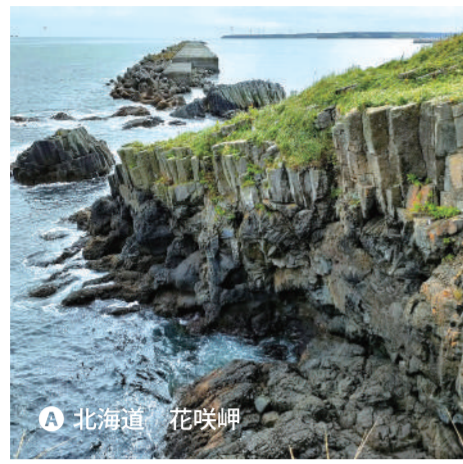
A 北海道 花咲岬