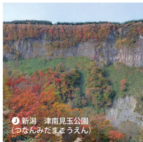
J 新潟 津南見玉公園 (つなんみたまこうえん)