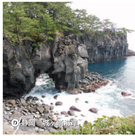
D 静岡 城ヶ崎海岸