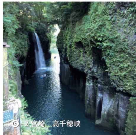
G-2 宮崎 高千穂峽