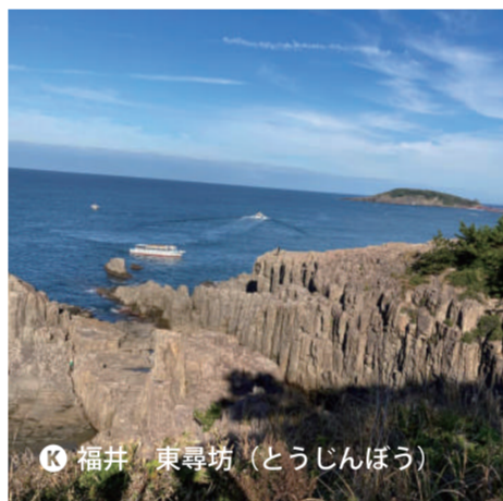
K 福井 東尋坊 (とうじんぼう)