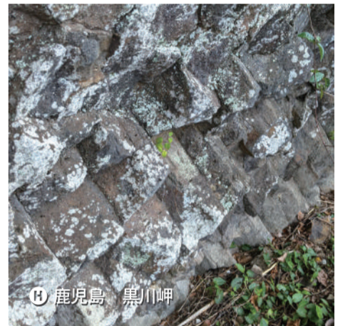
H 鹿児島 黒川岬