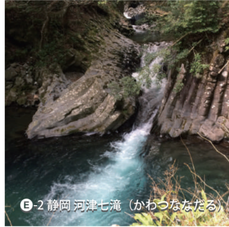
E-2 静岡 河津七滝 (かわつななだる)