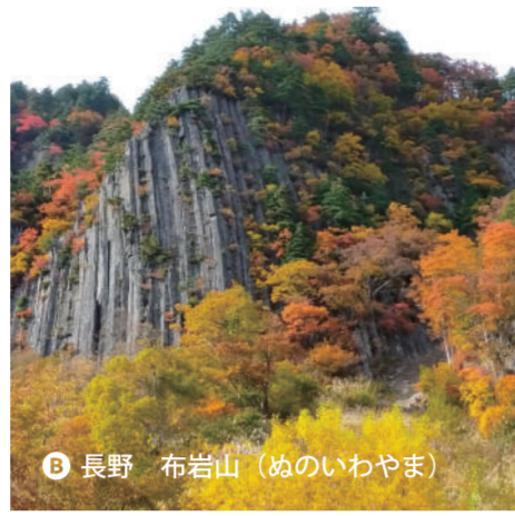
B 長野 布岩山 (めのいわやま)