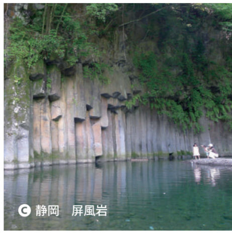
C 静岡 屏風岩