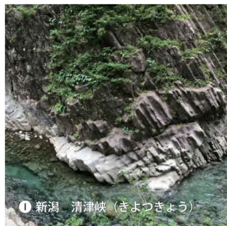
I 新潟 清津峽 (きよつぎょう)