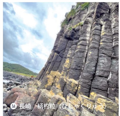
M 長崎 柄杓粒 (びしゃくりゅう)