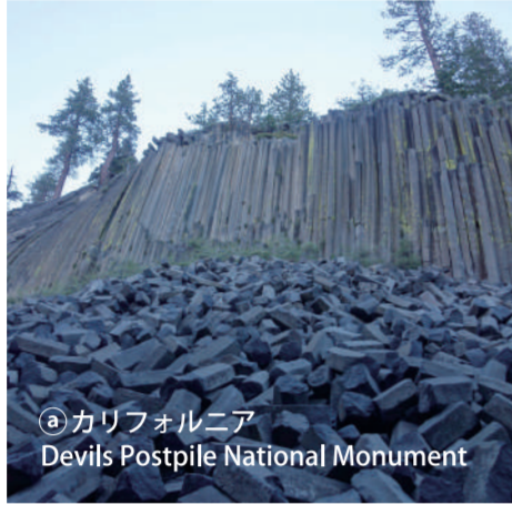
◎カリフォルニア Devils Postpile National Monument